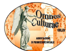
Premio Nazionale Nobildonna Maria Santoro